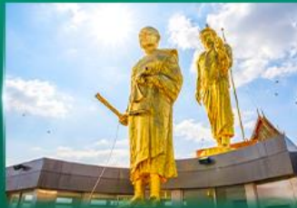
หลวงพ่อคูณ วัดบ้านไร่