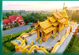
วัดเทพนิมิตประดิษฐ์