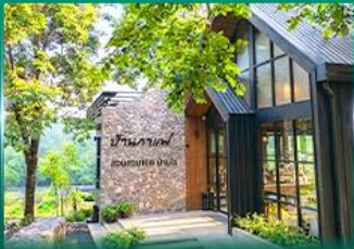
ร้านอาหาร สวนสวย 168